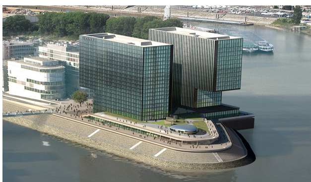
ePos Projekt Hafenspitze Düsseldorf (Hyatt)