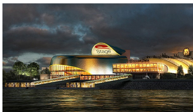
ePos Projekt Theater im Hafen Hamburg